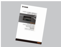
Краткое руководство по установке