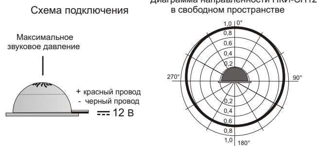
Рис.2 Схема подключения и диаграмма направленности звука оповещателя ПКИ-СП12.

5.3. На рис.2 показана схема подключения и диаграмма направленности звука ПКИ-СП12.